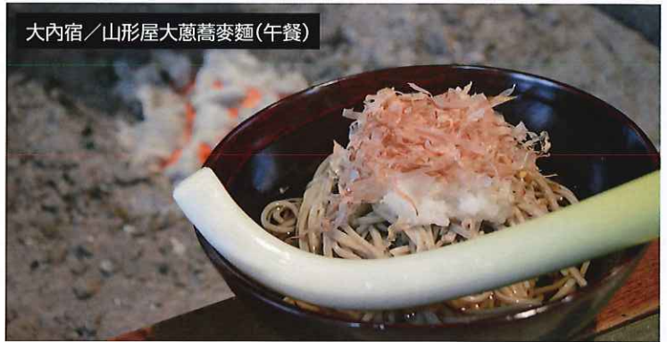
大內宿/山形屋大蔥蕎麥麵(午餐)

鶴城被譽為堅不可摧的名城,在戊辰戰役中,挺住了新政府軍的猛烈攻擊。1965年9月重建,並於2011年春季,成為日本唯一一座披上了幕末時代的瓦片(紅瓦)的天守閣。